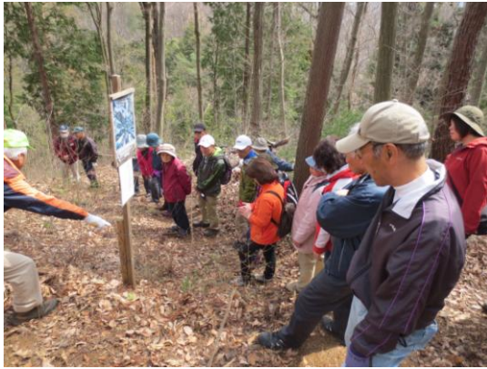
花の説明を聞く参加のみなさん

遊歩道を歩き、木々の葉っぱが出るまえの中を30分程歩き霊静山境内に到着、甘酒で疲れを癒し、明治から昭和20年代まで行われていた信仰、祀られている石仏群について説明し11時頃に解散しました。