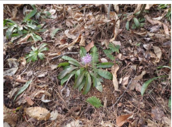
花で迎える猩々袴とその子ども