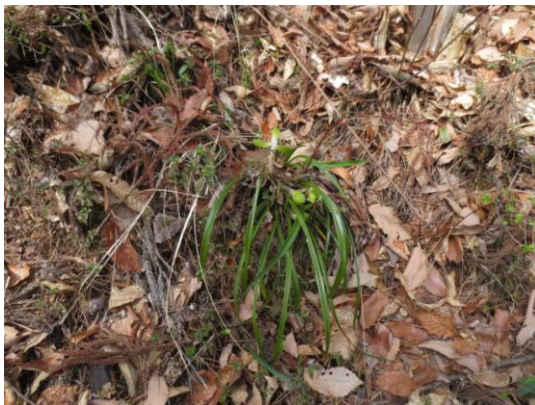
ひっそり咲いている春蘭