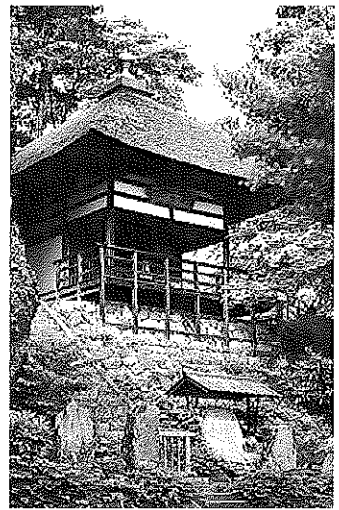
姨捨山長楽寺観音堂（信濃第十四番札所）

文化11年（1814）、麓の八幡宮（武水別神社）神宮寺の弟子円心が中興開基したと伝わる。本尊は聖観世音菩薩、信濃三十三霊場14番札所でもある。歌枕の里にふさわしい境内には、芭蕉翁面影塚をはじめ多くの歌碑や句碑が立つ。姨捨伝説の姨捨山だと伝わる姨石は、高さ約15m、幅・奥行約25mの巨岩。岩上から見る棚田、千曲の流れ、善光寺平の眺望も見事。