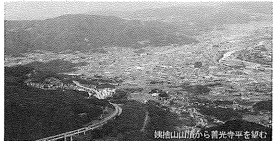
姨捨山山頂から善光寺平を望む

戦国時代から江戸初期の間に宿駅制度を整えることで成立。洗馬宿～善光寺間南北19里20町（約80km）、12の宿場と3つの峠で結ぶ庶民の道、信仰の道だった。また、城下町松本と門前町善光寺という信濃の経済・文化の中心地を結ぶ人や物資移動の大動脈でもあった。洗馬で中山道と分かれ、松本城下を経て山間地に入り、東山道（北陸道連絡路）と重なりながら、猿ヶ馬場峠を越えて善光寺平の南端・稲荷山宿に至り、篠ノ井追分で北国街道に合流。善光寺へと向かった。