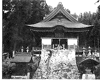
金峯山長谷寺観音堂（信濃第十八番札所）

日本三所（日本三大長谷寺）と呼ばれ、大和・鎌倉・信濃と並び称される古刹。寺伝（白助物語）には、舒明天皇年間（629～641）、允恭（いんぎょう）天皇六代の子孫・白助が、善光寺如来のお告げを得て、聖地大和長谷山中に向き、供養三昧の日に感得した本尊十一面観音像を造り、一字を建立したとある。信濃33観音霊場18番札所。春は一面の桜、千曲市一望の景観も素晴らしい。